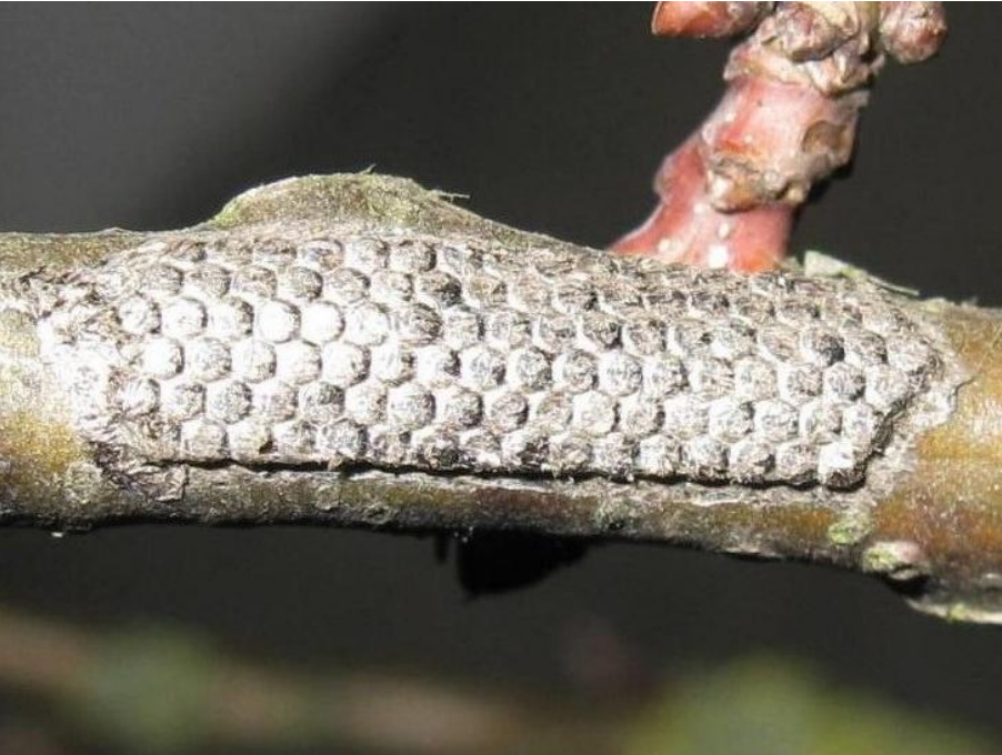
Eigelege des Eichenprozessionsspinners