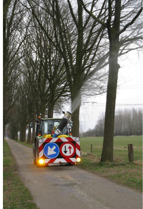
Tab. 1: Nach Pflanzenschutzgesetz gegen Eichenprozessionsspinner anwendbare Insektizide auf Flächen, die für die Allgemeinheit bestimmt sind (Stand der Daten: Januar 2026)

Die sachgerechte Ausbringung der Insektizide ist aufwändig und erfordert Spezialgerät. Daher sind Spezialfirmen (s. o.) zu konsultieren, um unnötige Risiken bei der Ausbringung zu vermeiden. Der beste Zeitraum zur erfolgreichen Bekämpfung ist ab dem Laubaustrieb bis etwa Mitte Mai gegeben, so lange keine Brennhaare entwickelt sind. Zudem sind jüngere Raupen empfindlicher als ältere Stadien – kurz vor der Verpuppung sind Behandlungen mit Insektiziden nicht mehr sinnvoll.