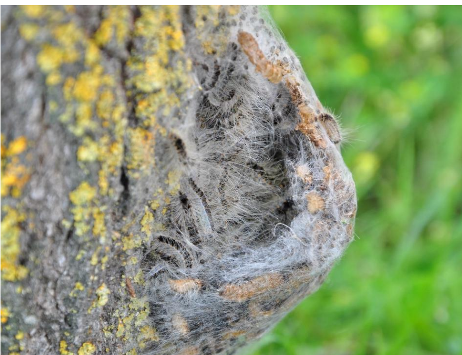
Nest mit aktiven Raupen