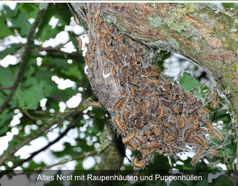
Altes Nest mit Raupenhäuten und Puppenhüllen