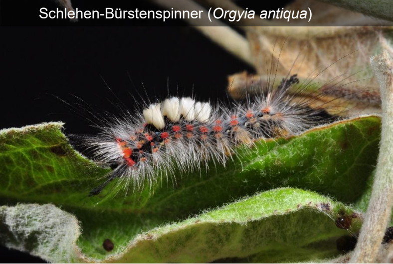
Schlehen-Bürstenspinner ( Orgyia antiqua )