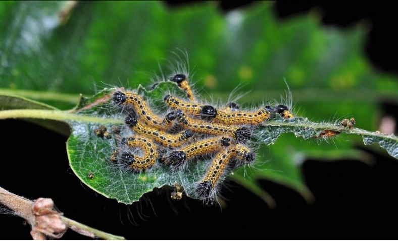
Mondvogel ( Phalera bucephala )

An Eichen kommen verschiedene Raupen vor, die zur gleichen Zeit wie der Eichenprozessionsspinner fressen und zu deutlichen Fraßschäden bis hin zu Kahlfraß führen können. Insbesondere Raupen, die in größeren Gruppen gemeinschaftlich fressen und behaart sind, werden oft verwechselt: