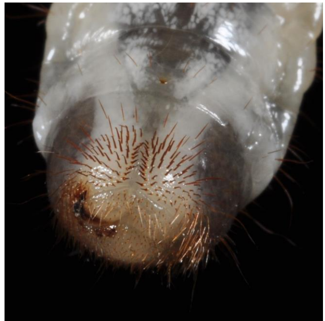
Abb. 5: Borstenfeld der Junikäferlarve