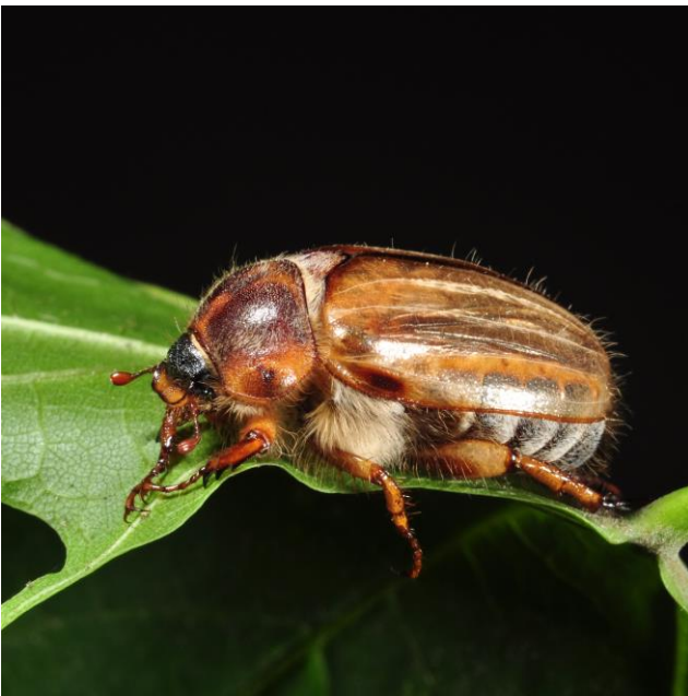
Abb. 4: Junikäfer

Die braun gefärbten, etwa 15 bis 18 mm großen Käfer (Abb. 4) schlüpfen und schwärmen etwa Mitte Juni bis Anfang Juli in den Abendstunden, wobei der Flug nur kurzzeitig anhält. Nach der Begattung der Weibchen legen diese die Eier in kleinen Gruppen oder auch einzeln in etwa 10 cm Bodentiefe ab. Nach dem Schlupf der Larven beginnen diese an Graswurzeln zu fressen, auch an Stauden und Gehölzen kann Wurzelfraß auftreten. Die Larve entwickelt sich im Laufe von zwei (warme Regionen) oder drei Jahren (kühlere Landesteile). Die Larven sind im reifen Zustand bis zu 30 mm lang. Bevorzugt werden trockene, sandige Böden besiedelt, während feuchte Flächen gemieden werden.