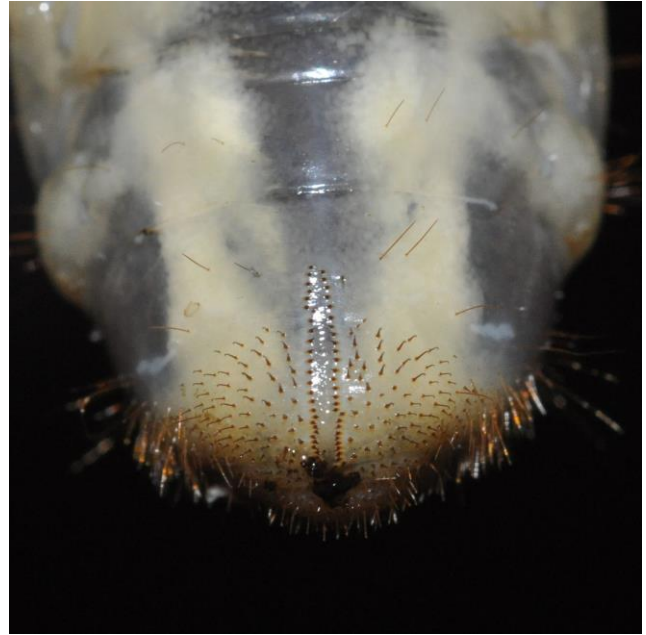
Abb. 7: Borstenfeld der Maikäferlarve.