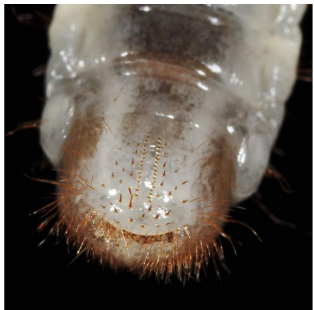
Abb. 3: Borstenfeld der Gartenlaubkäferlarve