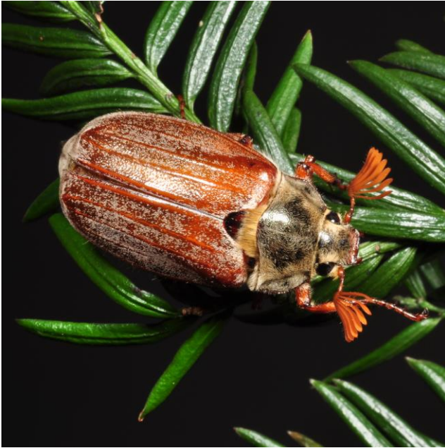
Abb. 6: Maikäfer (männlich)