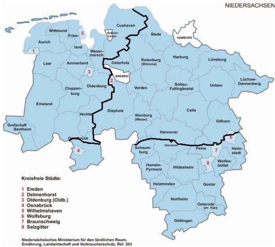
Abb. 2: Regionen mit unterschiedlicher Kalkungsdringlichkeit: Bergland, westliches Tiefland, östliches Tiefland