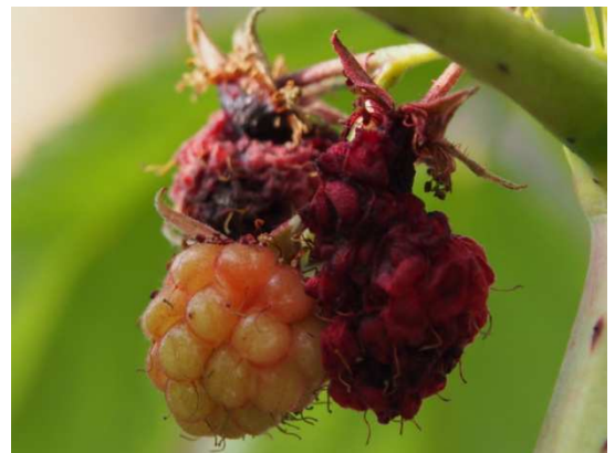
Abb. 1: zusammenbrechende Himbeeren

Ab Juli/August zunehmender Befall an gesunden Früchte, die noch an der Pflanze hängen und innerhalb kurzer Zeit kollabieren können (Abb. 1). In ihnen finden sich meist mehrere beinlose, weiße Fliegenmaden (Abb. 2). Weniger stark befallene Früchte können noch lange Zeit äußerlich in Takt erscheinen. Häufig kommt es zu sekundärem Befall mit Pilzen oder Bakterien. Der Schaden kann bis zu 100% betragen.