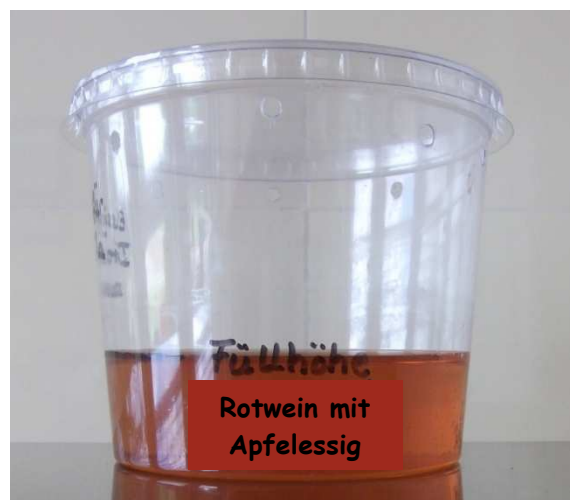
Abb. 8: Füllhöhe der Köderflüssigkeit in einer Falle mit bereits gebohrten Löchern