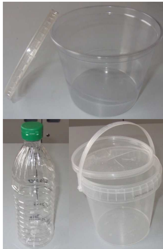
Abb. 7: geeignete Fallengefäße