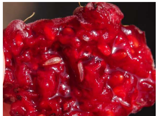
Abb. 2: Larven von D. suzukii

Alle beerenartigen bzw. weichschaligen Früchte: Kirsche, Erdbeere, Brombeere, Himbeere, Stachelbeere, Johannisbeere, Heidelbeere, Holunder, Pflaume, Pfirsich, Nektarine, Aprikose, Feige, Kiwi, Weintraube, Traubenkirsche, Lorbeerkirsche, Hartriegel, etc. Bevorzugt werden dunkle Beeren. Auch in den Früchten des Efeus können sich die Tiere vermehren.