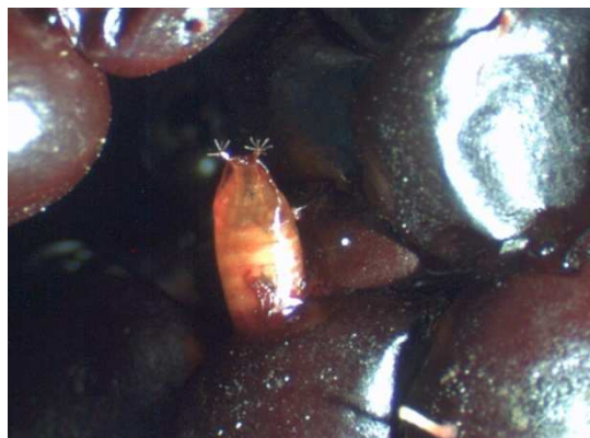
Abb. 5: aus der Fruchthaut ragende Puppe mit sternförmigen Fortsetzen