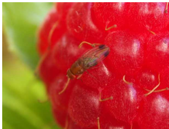
Abb. 6: D. suzukii -Männchen