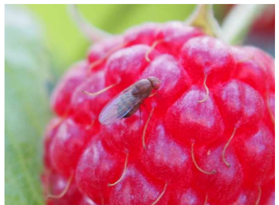
Abb. 3: D. suzukii -Weibchen

Die Kirschessigfliege ist ca. 3 mm groß und gehört zur Familie der Tau- oder Essigfliegen ( Drosophilidae ). Im Gegensatz zu heimischen Essigfliegen ist das Weibchen der Kirschessigfliege (Abb. 3) allerdings in der Lage, mit Hilfe eines sägeartigen Legebohrers die gesunden, reifenden Früchte, die sich noch an der Pflanze befinden, anzustechen und in diese Eier mit typischen fadenförmigen Atemanhängseln abzulegen. Atemanhängsel und Anstichstellen sind mit dem bloßem Auge kaum zu erkennen (Abb. 4).