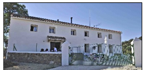
Ausbildungszentrum und Wohnheim „Vallebarco“