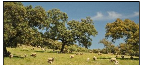
Agroforstsystem: Tierhaltung in Korkeichenhainen

Bewerbungen werden ab sofort angenommen.