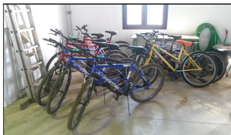
Fahrräder für die Erkundung der Region

Bei Fragen zu den Voraussetzungen, der Beantragung, der Organisation und den Fördermöglichkeiten nehmen Sie gerne Kontakt mit uns auf!