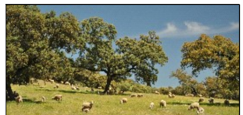
Agroforstsystem: Tierhaltung in Korkeichenhainen

Bewerbungen werden ab sofort angenommen.