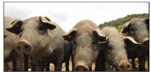
Iberische Schweine ernähren sich von Eicheln