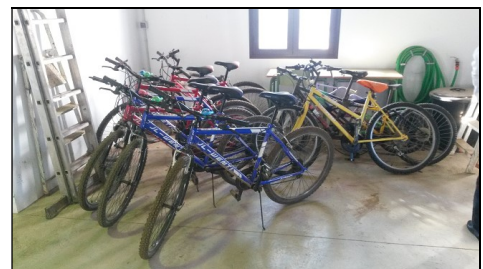
Fahrräder für die Erkundung der Region

Bei Fragen zu den Voraussetzungen, der Beantragung, der Organisation und den Fördermöglichkeiten nehmen Sie gerne Kontakt mit uns auf!