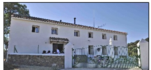
Ausbildungszentrum und Wohnheim „Vallebarco“