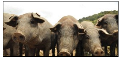
Iberische Schweine ernähren sich von Eicheln